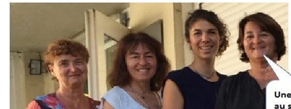
Une équipe au service de chacun

4 Maîtres Accompagnateurs-Formateurs qui ont une classe, des collègues. Ils ont l'expérience des trois cycles. Leur rôle est d'accompagner et de former les enseignants.