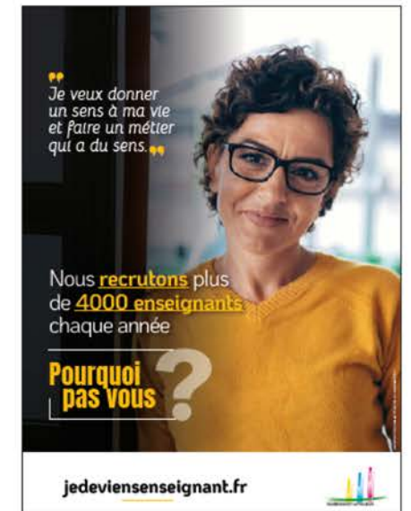
En reconversion professionnelle